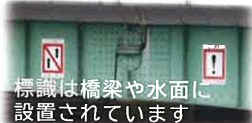
標識は橋梁や水面に設置されています